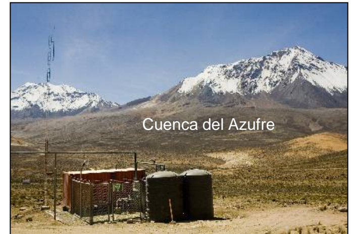
Pozo en la cuenca del Azufre