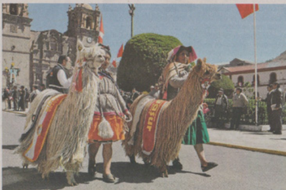
La alpaca es el producto bandera de la región altiplánica. Urge impulsar su crianza y mejoramiento.

La alpaca es un camélido sudamericano que fue domesticado en los andes peruanos desde tiempos preincas. Por ser un animal bandera en Puno, y debido a sus propiedades, calidad de su lana se revaloriza su crianza y riqueza genética. En ese sentido, desde el año 2012, todos los 1 de agosto se recuerda el Día Nacional de la Alpaca, esto tras aprobarse mediante la resolución 0249-2012 del Ministerio de Agricultura. En la región Puno la alpaca contribuye a la economía familiar del poblador